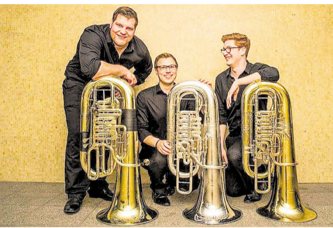
21meter60 nennen sich die drei jungen Tubisten, die ein außergewöhnliches Konzert in der Ev. Kirche in Lennep geben.

Am Freitag, 16. März, um 20 Uhr tritt die Ulla Meinecke Band im Live Club (LCB) in Wuppertal-Barmen auf, und stellt dabei die neue CD vor. Karten kosten im Vorverkauf 25 Euro (zzgl. Geb.), an der Abendkasse zu 29,50 Euro.