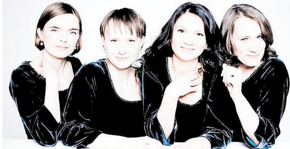
Das Klenke Quartett eröffnet am Samstag, 17. März, das Passions-Wochenende in der Historischen Stadthalle Wuppertals.

Öffnungszeiten: Mo.-Fr. 8 - 20 Uhr Sa. 8 - 20 Uhr